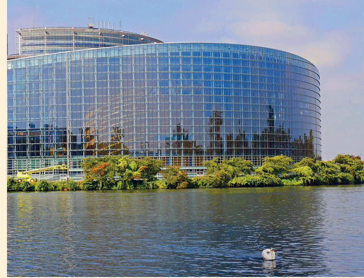
Strasbourg, Grand Est, France

Idéalement située au carrefour d'axes ferroviaires et routiers majeurs, elle jouit d'une position stratégique enviée, renforcée par sa connexion directe au Rhin, première voie fluviale de l'Hexagone.