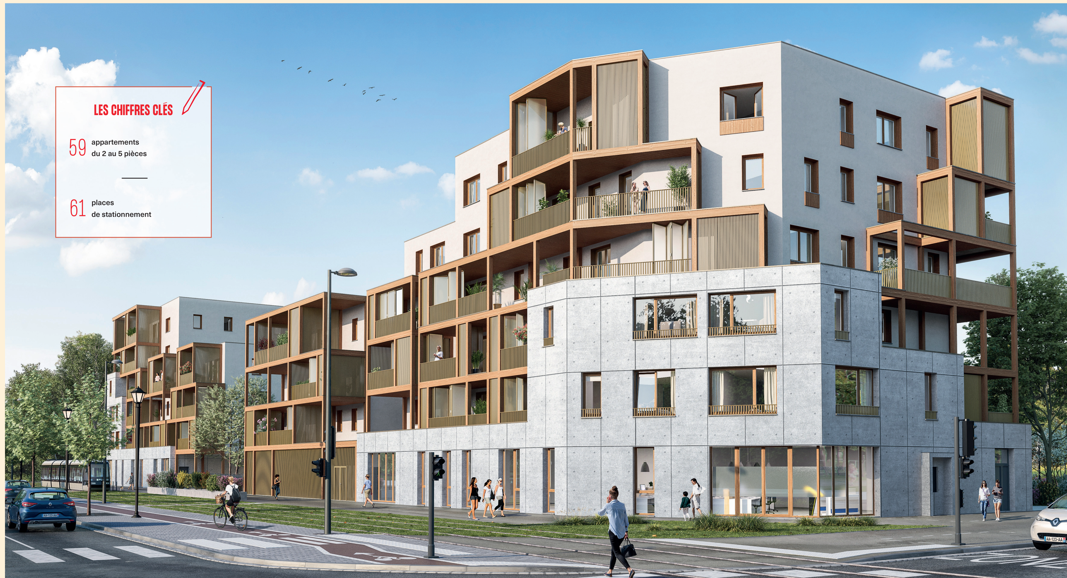
Avenue du Neuhof